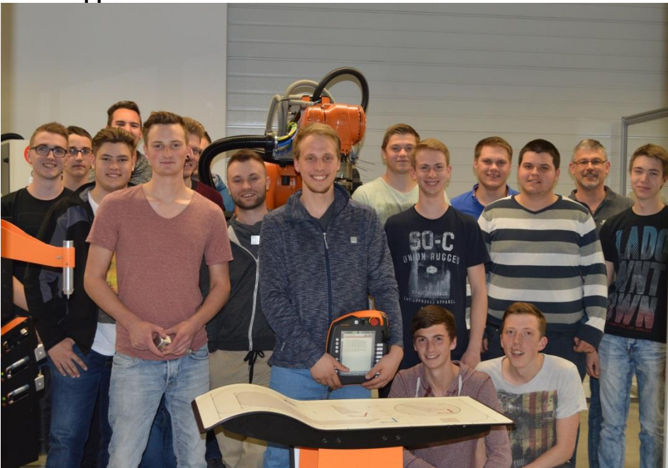
Bild: Mit viel Engagement und Motivation dabei: Schüler der Erwin Teufel Berufsschule in Spaichingen. Die Mechatroniker-Klasse im dritten Lehrjahr lernten mit Begeisterung bei der SHL AG in Böttingen Grundlagen im Umgang mit Industrierobotern.